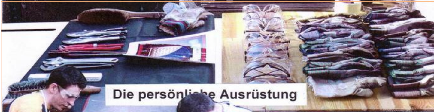
Die persönliche Ausrüstung