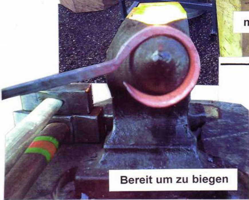
Bereit um zu biegen